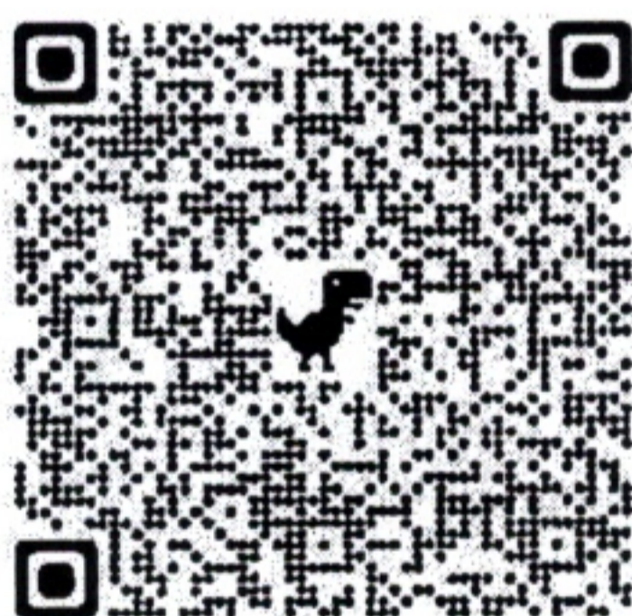
QR Code สมัคร